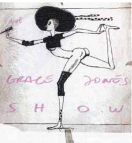
Grace Jones, de maakbare, en 'Zwarten', een van de vier etnische groepen waar Goude in 1975 rond werkte in de VS.